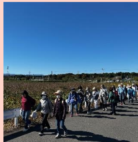
池尻池公園で昼食